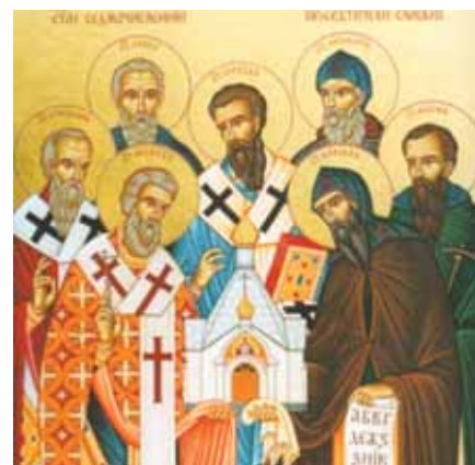
Svatí Sedmipočetníci jako nositelé křesťanské víry a zakladatelé kostelů. Uprostřed sv. Gorazd s biskupskými insigniemi.

jeho zatvrzelých nepřátel. Ač o tom ne- ní písemný doklad, jeden či možná i dva z žáků mohli být po r. 880 Metodějovými sufragány, neboť funkční metropolitní or- ganizaci vždy tvořil arcibiskup a tři bisku- pové, z nichž prvním byl již jmenovaný Wiching. Ze skupiny sv. Sedmipočetníků velmi pravděpodobně biskupskou funkci zastával Gorazd, neboť právě jeho si Meto- děj před smrtí vyvolil za svého nástupce. Že se Gorazd nástupnictví nedočkal, víme. Biskup Wiching a s ním militantně naladě- ný latinský klérus nedopustili pokračování byzantské tradice na Moravě. Patrně s vě- domím knížete Svatopluka vyhnali Meto- dějovy stoupence, řada kněží byla prodána