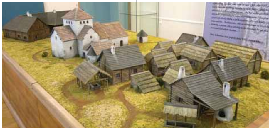
Církevní komplex v Sadech je přisuzován působnosti moravského metropolity. Obdobný sídelní celek s kostelem mohl stát poč. 10. století také na Vyšehradě.

kteřá zasahuje i do zemí sousedních Slo- vanů, do Polska, Panonie. Spolu s mo- cí knížete Svatopluka Metoděj svým vli- vem vstupoval i do dění v Bohemii, již bavorští biskupové od dob císaře Karla Velikého považovali (ostatně taktéž Mo- ravu a Panonii) za vlastní misijní provin- cii. Konflikt s bavorským episkopátem a s odpůrci zavádění řeči Slovanů do cír- kevní praxe provázely byzantské vyslance