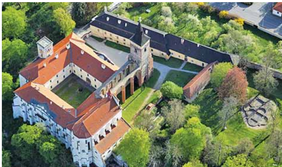
Kostel sv. Kříže na půdorysu tetrakonchy v areálu Sázavského kláštera je možná pokračovatelem nejstaršího Vyšehradského kostela.