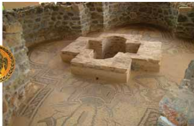
Byzantská ikona s archandělem Michelem na symbolickém půdorysu tetrakonchy, ve východním křesťanství často užívané formy chrámu. Tetrakoncha jako baptisterium – křtitelnice – v církevním středisku biskupa Klimenta v Ochridu.